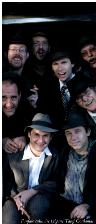
Fanfare culinaire tzigane Taraf Goulamas