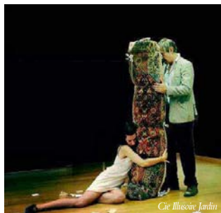
Cie Illusoire Jardin

Danse et théâtre, ici, ne sont ni distincts ni complémentaires. Ils se mêlent, résonnent et interfèrent sans cesse, amplifiant et éclairant les démons intérieurs de cet homme-clown qui se dévoile peu à peu dans sa touchante nudité.